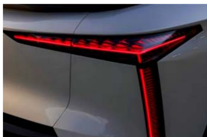
Confort de primera clase

DS N° 8. Diseño, aerodinámica y acabados que cautivan a primera vista.