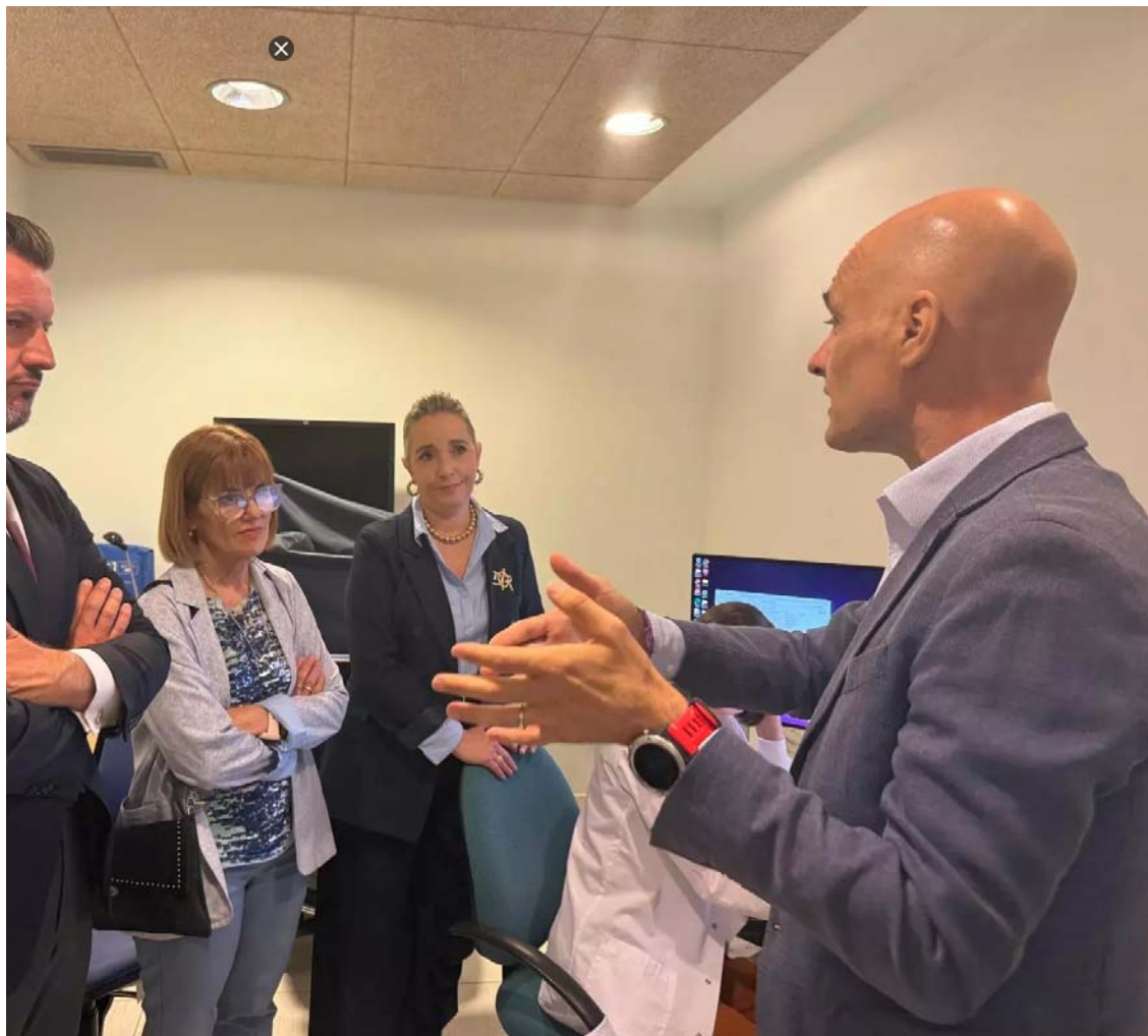
Lastra y Rodil han atendido a los responsables de la Fundación Reina Sofía en Madrid

ganizado de manera conjunta por la Fundación Reina Sofía , el Centro de Investigación de rológicas (CIEN) —dependiente del Ministerio de Ciencia, Innovación y Universidades—, el che y la Sociedad Española de Neurología .