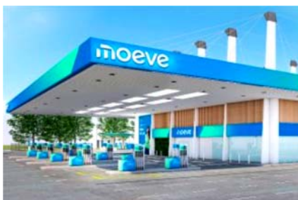
Cepsa Gow es Moeve gow

DS N° 8. Diseño, aerodinámica y acabados que cautivan a primera vista.