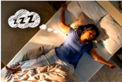
Los colchones de IKEA Colchones para dormir a pierna suelta con los mejores materiales.

Comorbilidades Depresión Diagnóstico Jóvenes Migraña Mujeres Salud mental