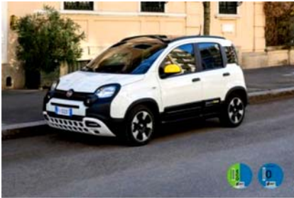
Hasta 6.000€ de descuento Aprovecha los Fiat Days y empieza a pagar en 2026