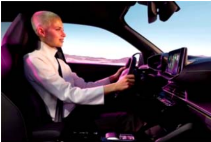
Peugeot 2008 Solo este mes: Tu Peugeot 2008 con una oferta irresistible