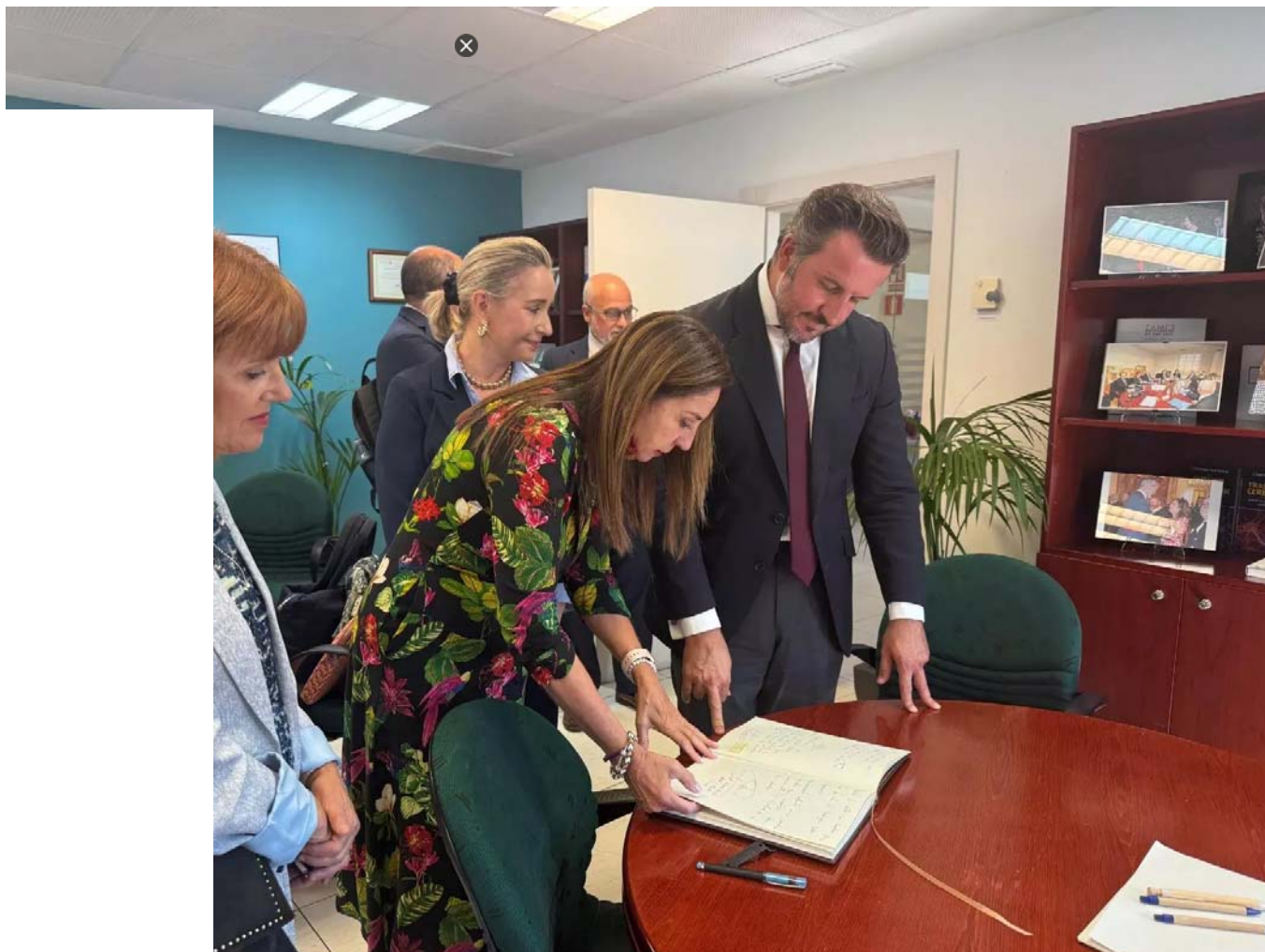
ción Reina Sofía y la Fundación Cien para cerrar los detalles del congreso en Elche / INFORMACIÓN