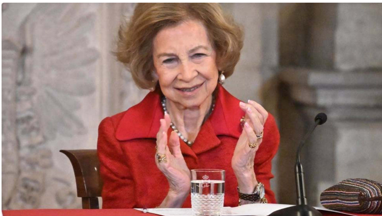
Imagen de archivo de la Reina Sofía

Reunirá a más de un centenar de investigadores y expertos de referencia mundial