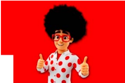
Fibra 1Gb y 120GB 5G Fibra 1Gb y 120GB 5G por 38€/mes. Añade líneas adicionales por 10€/mes