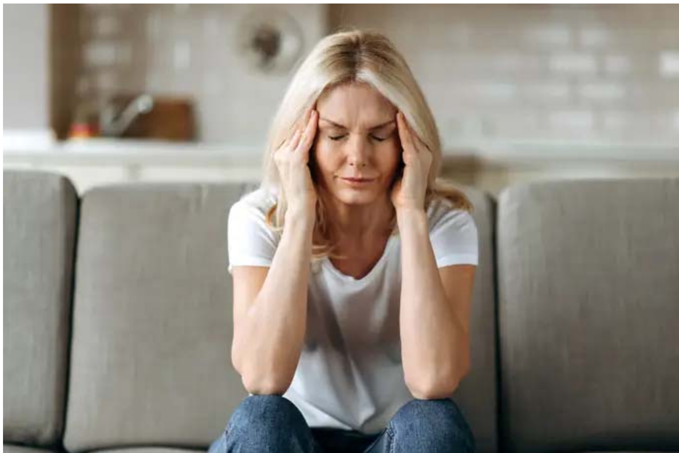
Archivo - Imagen de recurso de una mujer con síntomas de migraña.